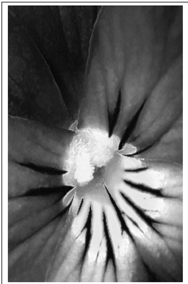
Lieszkönszky Veronika: Árvácska-I. (eredetileg színes)