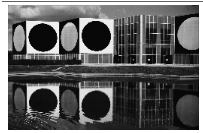
Gulyás László: Vasarely-vízió (eredetileg színes)