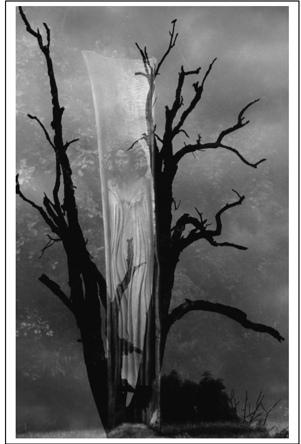
Farkas Zsolt: Lélekjelenlét (eredetileg színes)