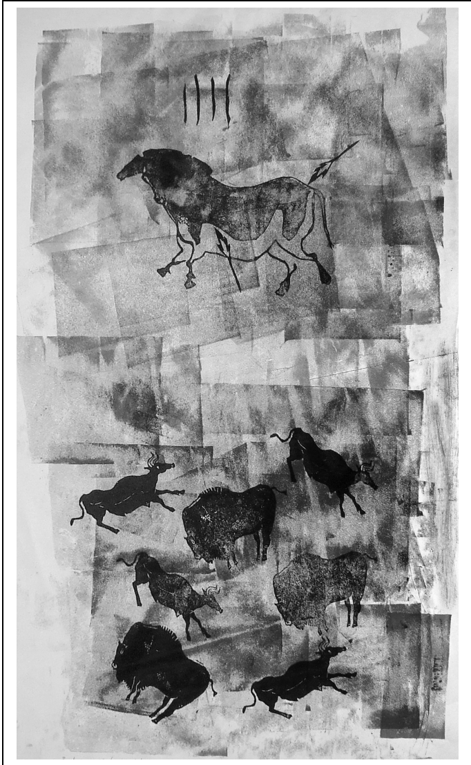
Lénárt Attila: Barlangrajz (vegyes technika), 2007 (eredetileg színes)

a Hajdú-Bihar megyei Fiatal Alkotók Közösségének kulturális és művészeti folyóirata