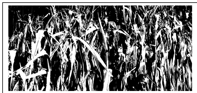
Az oldal illusztrációit Rékasi Attila készítette