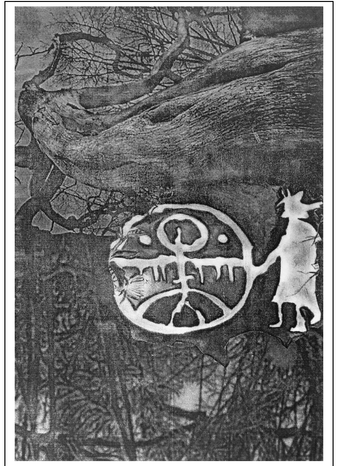
Lénárt Attila: Sámán (Transzfer), 2007

www.mikepercs.hu/intezmenyek www.kiskonyvtarak.hu