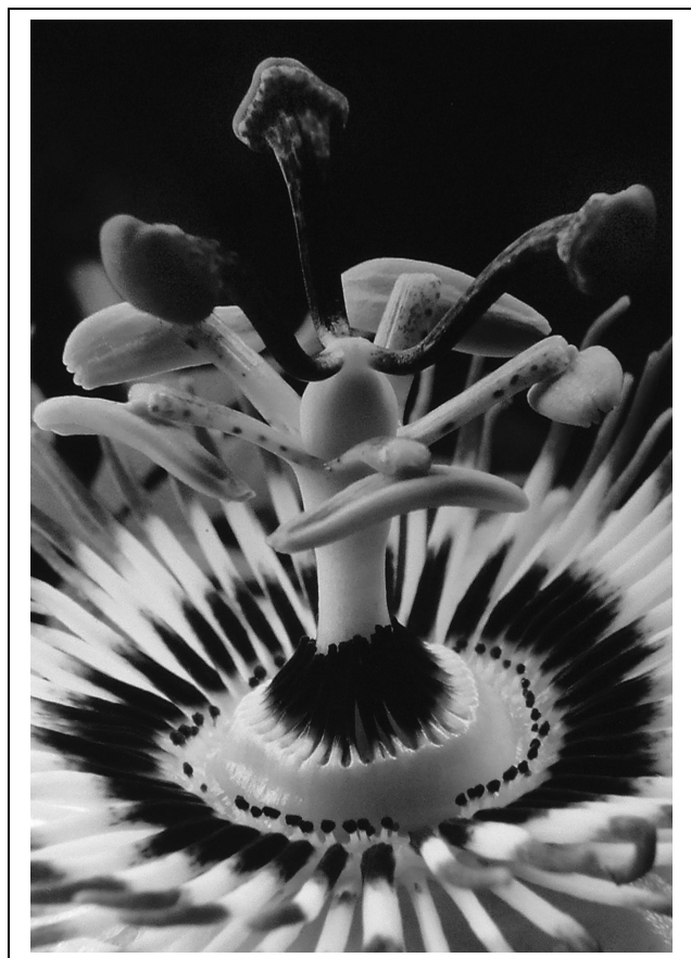
Nagy István: Roulette (eredetileg színes)